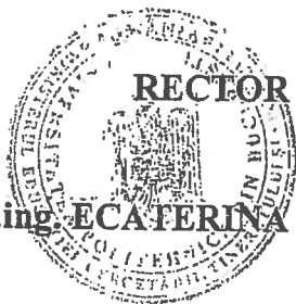
Prof. Dr.ing. ECATERINA ANDRONESCU

ART. II - Prezenta Decizie este redactată pe două pagini și se va difuza prin grija Secretariatului tehnic al Comisiei tuturor membrilor acesteia, precum și celorlalte structuri/compartimente ale Universității Politehnica din București, care vor acționa pentru realizarea prevederilor deciziei.